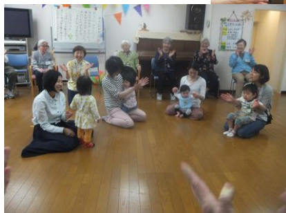
『みずきっこ合流会』